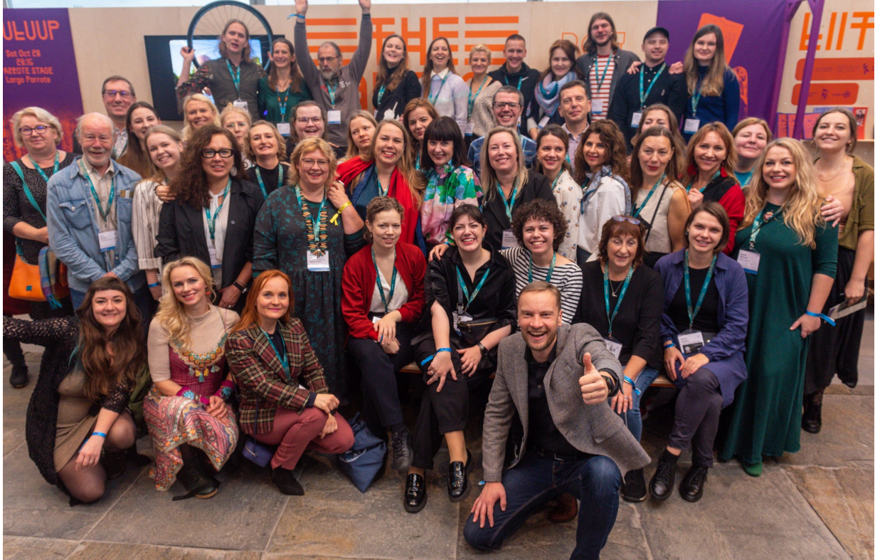
Jungtinis Baltijos šalių paviljonas WOMEX'23 Ispanijoje

Lietuvos muzikos informacijos centras 2023 metais tęsė savo visas pagrindines veiklas: kasdienes konsultacijas Lietuvos ir užsienio kultūros organizacijoms ir muzikos sektoriaus dalyviams, albumų ir natų leidybą, tinklaveikos ir bendradarbiavimo projektus, edukacines veiklas.